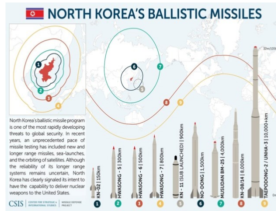
La gittata dei missili balistici Nord Coreani

Provvedimenti restrittivi nei confronti della Corea del Nord erano stati già adottati dalla UE, nell'ultimo periodo ci è stato un netto incremento. I principali sono: