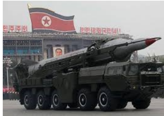
Parata militare a Pyonyang

Nel Consiglio dei Ministri degli esteri UE tenutosi il 16/10/2017 sono state adottate « nuove e più dure misure della UE in aggiunta a quelle dell'ONU contro la Corea del Nord ».