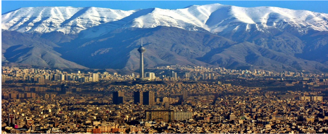
Panoramica di Teheran

Negli ultimi anni c'è stato un crescendo di sanzioni adottate dall'ONU nei confronti della Repubblica islamica dell'Iran, relative alla produzione e manipolazione di materiale nucleare all'interno delle centrali iraniane