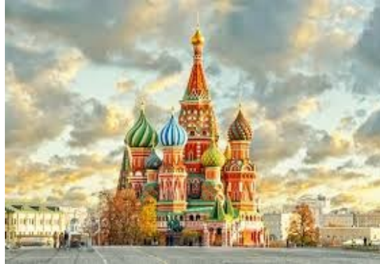
Cattedrale dell'intercessione della Madre di Gesù sul fossato vulgata San Basilio

A seguito della crisi ucraina ed al Trattato di annessione della Crimea alla Russia, la Comunità internazionale, specialmente USA ed UE, ha deciso per l'adozione ed estensione di sanzioni economiche e diplomatiche contro la Federazione Russa