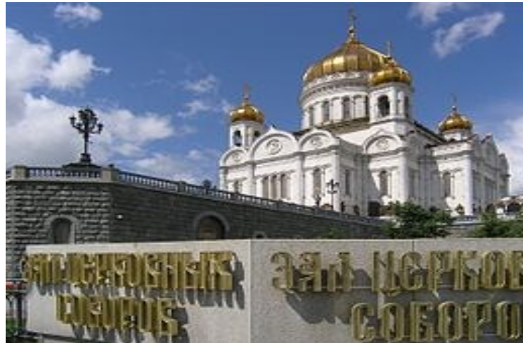
Cattedrale di Cristo Salvatore in Mosca ricostruita e riconsacrata il 19 agosto 2000

28 e 29.11.2013: terzo summit a Vilnius della Eastern Partnership della UE